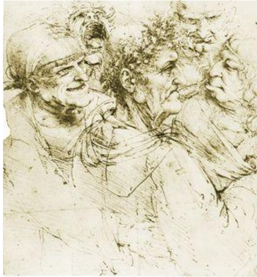
Cinco cabezas grotescas , ilustración de los cuatro temperamentos, en torno a un perfil clásico (dibujo de Leonardo da Vinci, hacia 1490, Royal Library, castillo de Windsor)

Médicos de la antigüedad como el médico griego Hipócrates (460-370 aec) y el médico turco-griego Galeno (129-200) distinguían cuatro tipos de temperamentos, considerados como emanación del alma por la interrelación de los diferentes humores del cuerpo: