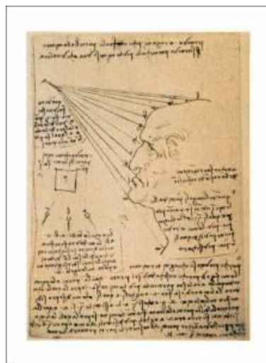
Estudio de la cara humana