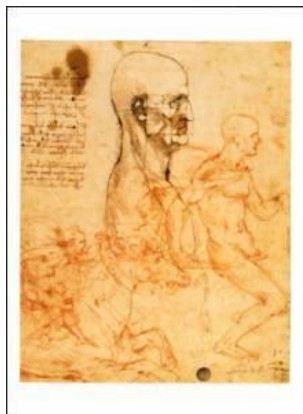
Estudio de la Fisionomía Humana

Basados en el hecho de que ninguna persona posee únicamente un temperamento en su personalidad, se desarrollaron a complementación de la pura clasificación de los cuatro temperamentos, las combinaciones de éstos donde uno de los temperamentos es el dominante y otro (u otros) es secundario; por ejemplo, se dice de la persona con temperamento COL-MEL cuando el temperamento COLérico es el dominante y el MELancólico es el suplementario . Por consiguiente, se tienen las distintas combinaciones, MEL-COL, FLEM-SAN, etcétera.